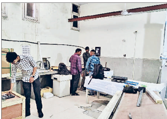
सोनीपत। मशीन को स्थापित करते हुए कर्मचारी।

बता दें कि नागरिक अस्पताल में हर रोज करीब दो हजार से ज्यादा मरीजों की संख्या है। वहीं नागरिक अस्पताल में हर दिन 120 से ज्यादा मरीज एक्स-रे करवाने आते हैं। डिजिटल एक्स-रे मशीन में एक्स-रे को धोने सुखाने की जरूरत नहीं पड़ती। एक्स-रे की रिपोर्ट मिनिटों में मिल जाती है। अस्पताल में