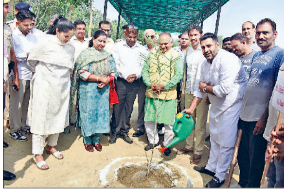
सोनीपत। हिन्दू गर्ल्स कॉलेज में पौधरोपण करती स्वयंसेवक।