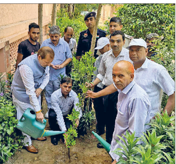
गोहाणा। पौधरोपण करते कैबिनेट मंत्री डॉ. अरविंद शर्मा।

सहकारिता, कारागार, निर्वाचन, विरासत व पर्यटन मंत्री डॉ. अरविंद शर्मा ने गुरुवार को विश्व पर्यावरण दिवस के अवसर पर एक पेड़ मां के नाम अभियान के तहत पौधरोपण किया। मंत्री ने कि विश्व पर्यावरण दिवस मनाए जाने का मकसद लोगों को पर्यावरण की सुरक्षा के प्रति जागरूक और सचेत करना है। प्रकृति बिना मानव जीवन संभव नहीं। ऐसे में यह बेहद जरूरी है कि हम पेड़ पौधों, जंगलों के महत्व को समझें। उन्होंने कहा कि इस बार विश्व पर्यावरण दिवस प्लास्टिक प्रदूषण को समाप्त करना थीम पर मनाया जा रहा है। उन्होंने बताया कि प्लास्टिक कचरा महासगरों को प्रदूषित कर रहा है, वन जीवों को नुकसान पहुंचा रहा है और हमारे भविष्य को खतरे में डाल रहा है। उन्होंने बताया कि रीसाइक्लिंग को अपनाकर, सिंगल-यूज प्लास्टिक का उपयोग न करके तथा अपनी उपभोग की आदतों में परिवर्तन करके हम एक स्वस्थ और प्लास्टिक मुक्त पर्यावरण की दिशा में कदम बढ़ा सकते हैं।