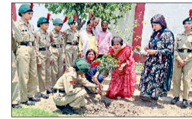
दी। जीवीएम की इंस्टीट्यूशंस इन्वेषेशन सैल (आईआईसी), एनएसएस व एनसीसी इकाई और