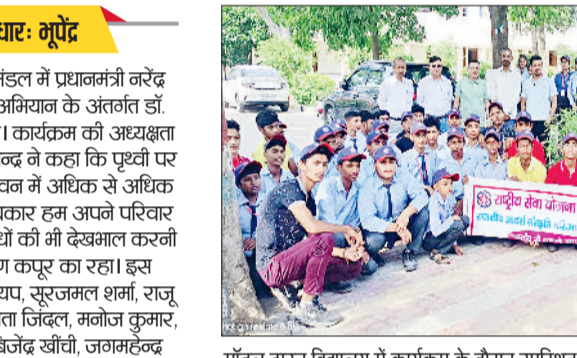
मॉडल टाउन विद्यालय में कार्यक्रम के दौरान उपस्थित स्वयंसेवक एवं अन्य।