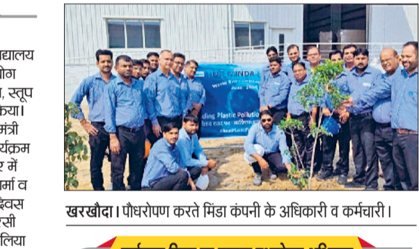
खरखौदा। पौधरोपण करते मिंडा कंपनी के अधिकारी व कर्मचारी।