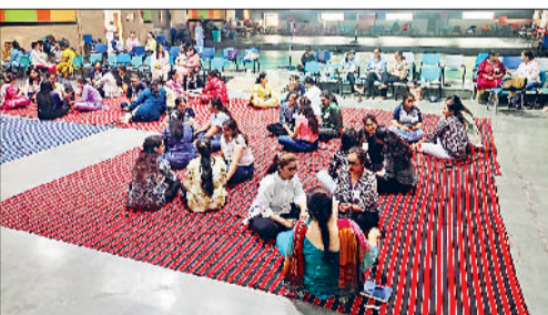
सोनीपत। शिविर में शामिल प्रतिभागी।