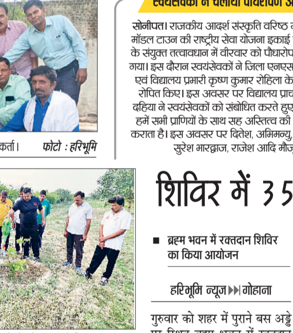
गोहाणा। पौधरोपण करते भाजपा नेता और कार्यकर्ता।